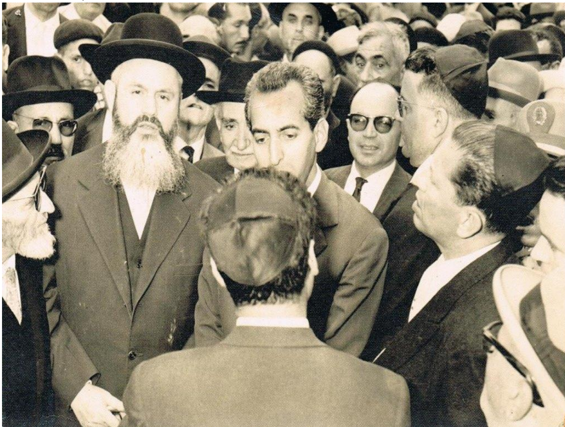
Rencontre de la communauté juive marocaine de Meknès Début XXe siècle