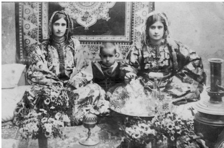
Famille juive du Maroc