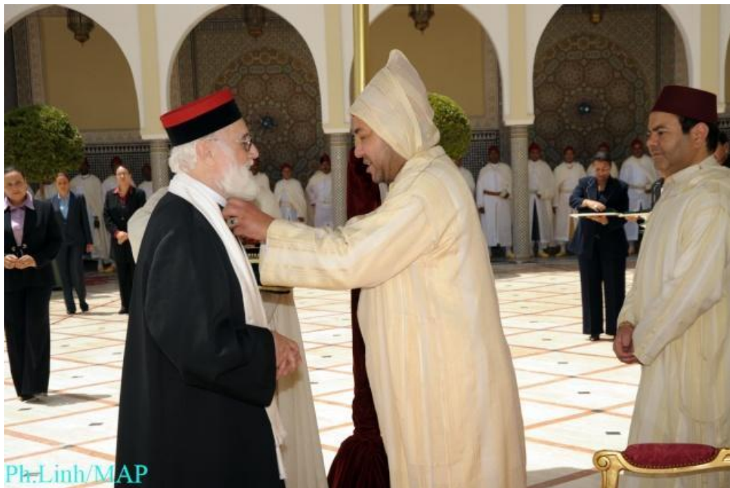
Décorations royales.

Dans le message Royal, il a été indiqué qu'au cours de son histoire, le Maroc a connu un modèle civilisationnel singulier de coexistence et d'interaction entre les musulmans et les adeptes d'autres religions, notamment les juifs et les chrétiens. Parmi les pans lumineux de l'histoire de cette concorde s'affirme la civilisation maroco-andalouse issue de cette convergence interreligieuse.