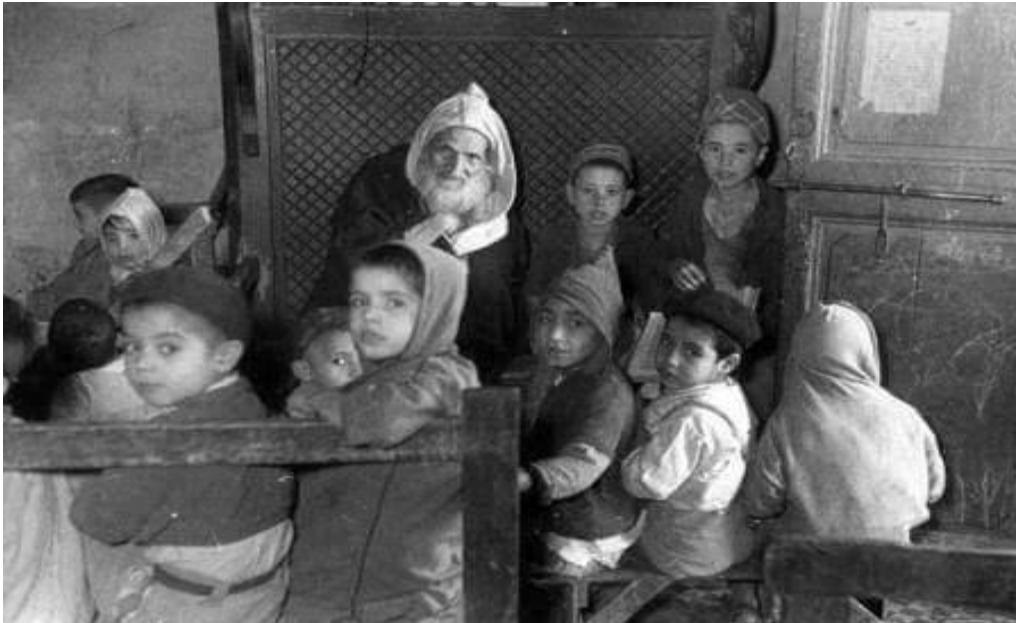
La vie juive au Mellah de Marrakech vers 1950.

D'abord en répétant tout le temps le mot Juif marocain, on se trompe sur notre identité car le mot Marocain contient en soi cette probabilité religieuse (revoir la Constitution). Un «Marocain de confession juive» serait alors plus juste pour parler du citoyen dans un sens spécifique. Les compatriotes le reconnaissent.