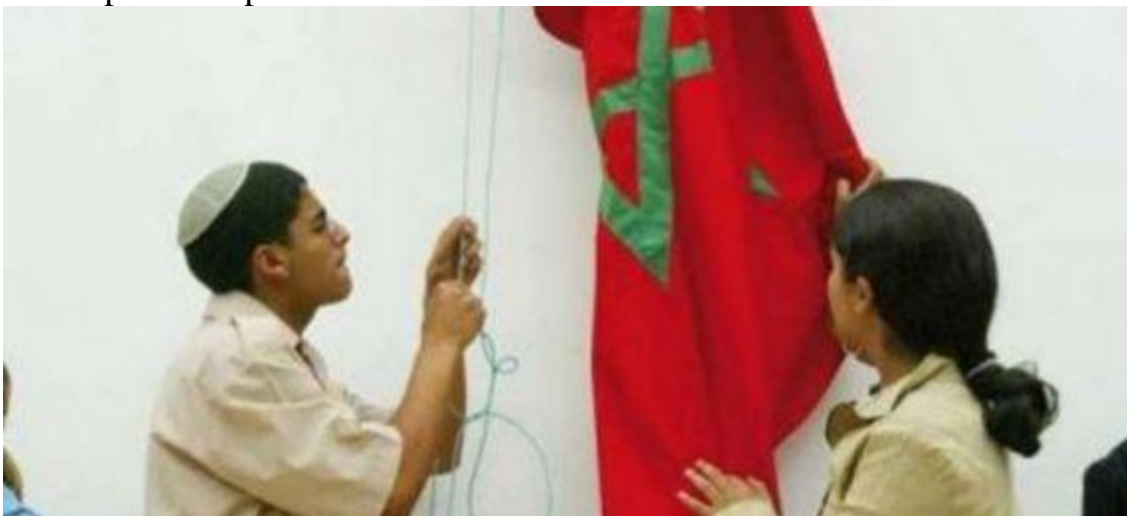
Le drapeau marocain dans le cœur des juifs et musulmans

Les membres de la diaspora véhiculent une très bonne image sur le Maroc et défendent leur pays avec beaucoup de courage. Le temps qui passe ne fait que renforcer leur attachement à la patrie et leur relation avec le Maroc passe aussi par d'autres canaux dont l'économie et l'associatif. Des associations diverses telles que l'Association des permanences du judaïsme marocain (APJM) ou encore l'association de la Synagogue Rambam qui est le lieu central des originaires du Maroc à Paris font beaucoup de travail dans ce sens pour maintenir les liens avec le Maroc. Le Rassemblement mondial du judaïsme marocain, né dans les années 1980, dans le prolongement de l'association Identité et Dialogue fondée par André Azoulay, conseiller du roi, ont également