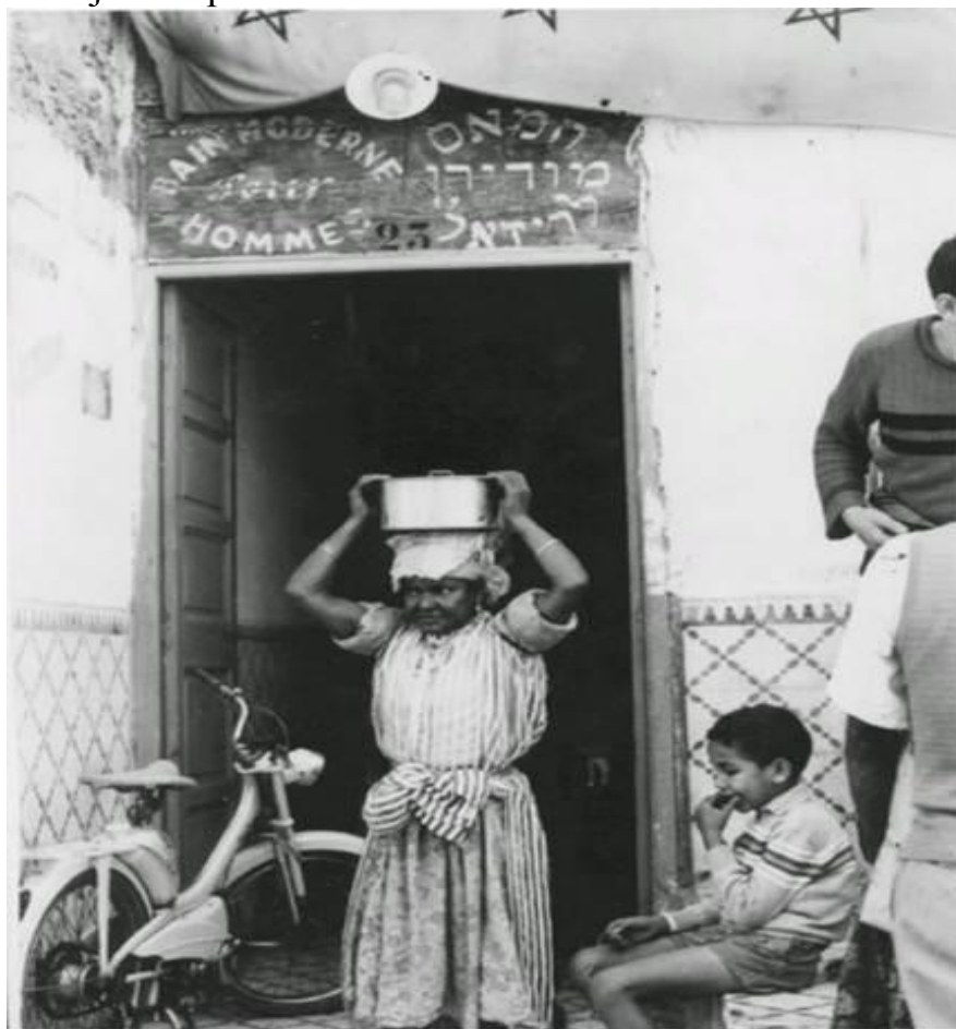
Four et bain public au Mellah de Casablanca les années 1950.